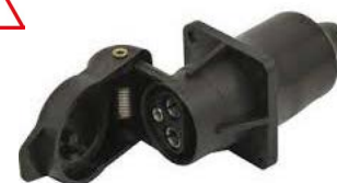
Prise nécessaire sur le tracteur